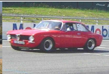
ALFA BERTONE VHC