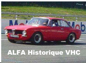
ALFA Historique VHC