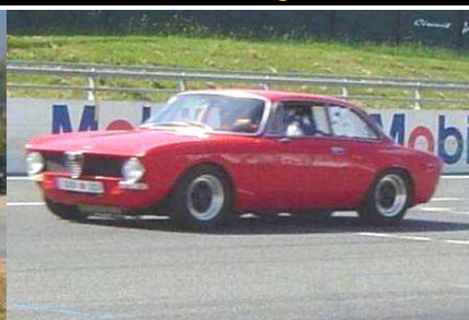
ALFA BERTONE VHC