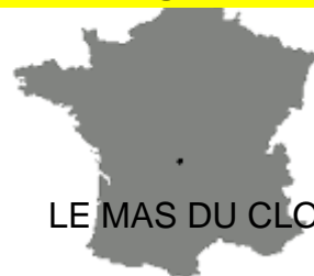
LE MAS DU CLOS

Les Puids 23200 Aubusson Le circuit est situé sur la N141 Accès entre : Limoges et Clermont-Ferrand