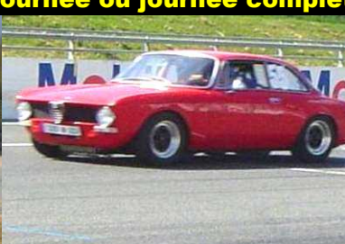
ALFA BERTONE VHC