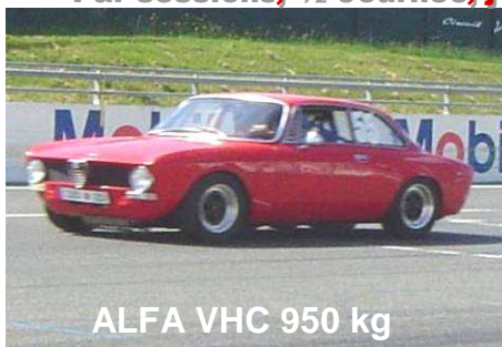
ALFA VHC 950 kg