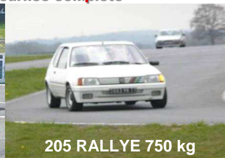
205 RALLYE 750 kg

Alain Annon, préparateur VHC sera présent toute la journée, pour vous aider en cas de panne