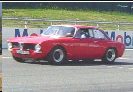
ALFA BERTONE VHC