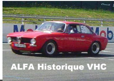
ALFA Historique VHC