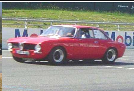
ALFA BERTONE VHC