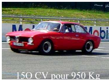
150 CV pour 950 Kg