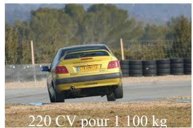
220 CV pour 1 100 kg