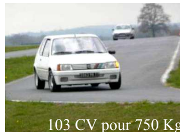
103 CV pour 750 Kg

Mr Alain Annon, préparateur VHC sera présent toute la journée pour vous conseiller en cas de problème. Nous pourrons également vous donner gratuitement des conseils de pilotage à bord de votre voiture.